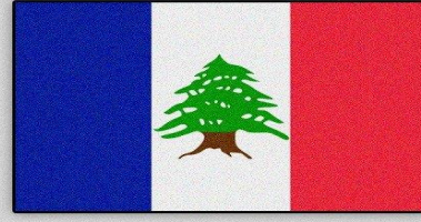
علم لبنان عام 1920