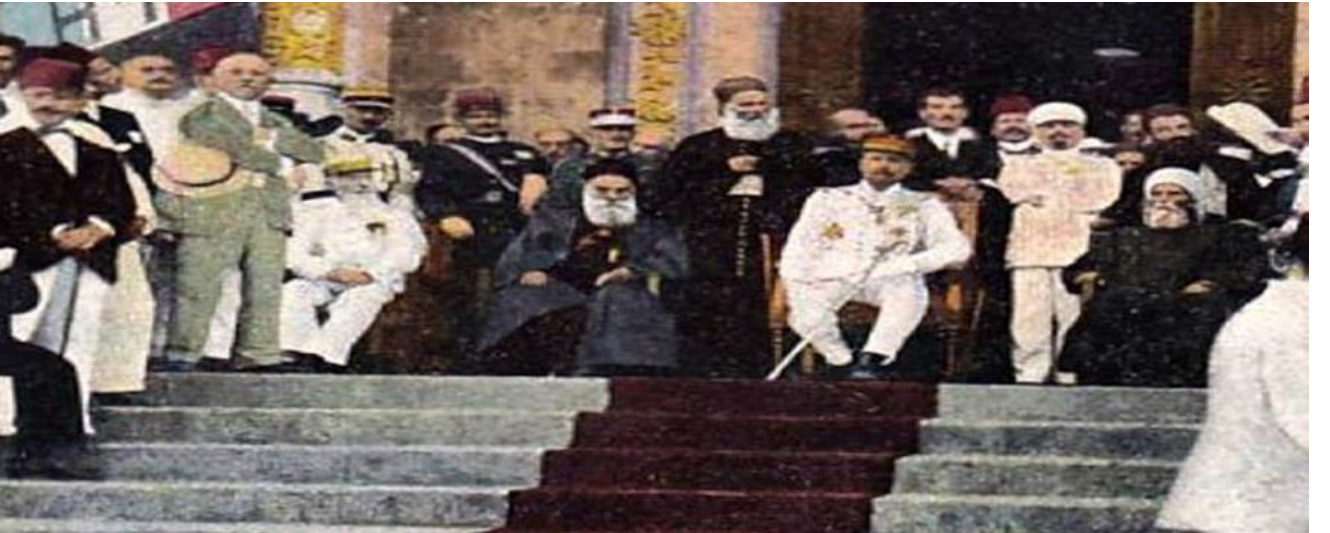
الاحتفال في قصر الصنوبر

ولا يسعنا عندما نُخبر هذه القصة إلا أن نذكّر رجالَ الاستقلال، هؤلاء الذين جاهدوا وحاربوا من أجل حريّة لبنان واستقلاله، وهم "رياض الصلح" و"كميل شمعون"، "عادل عُسيّران" و"حبيب أبو شهلا"، "مجيد أرسلان" و"صبري حمادة" و"عبد الحميد كرامي".