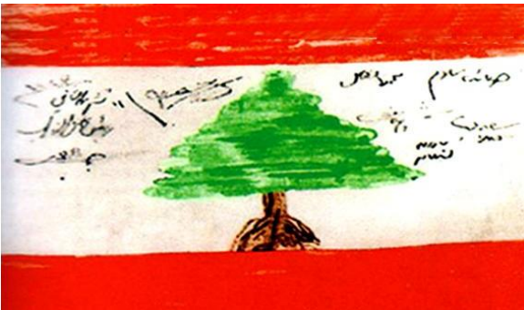
توقيع رجال الاستقلال على العلم اللبناني