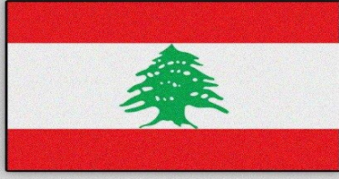
علم لبنان الحالي