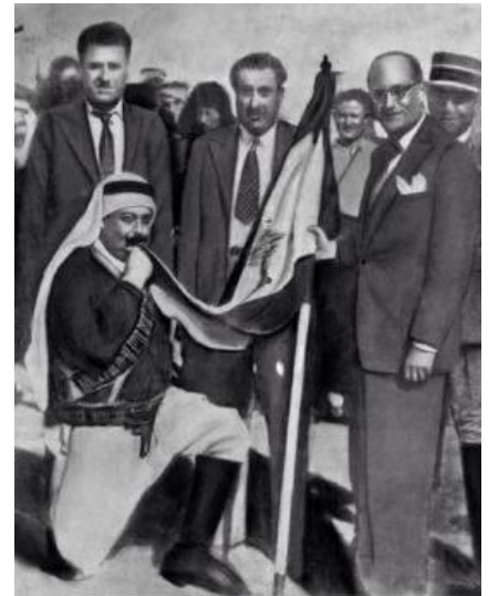
الأمير مجيد أرسلان يُقبل العلم اللبناني الحالي