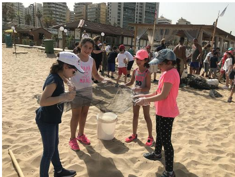
Opération Big Blue