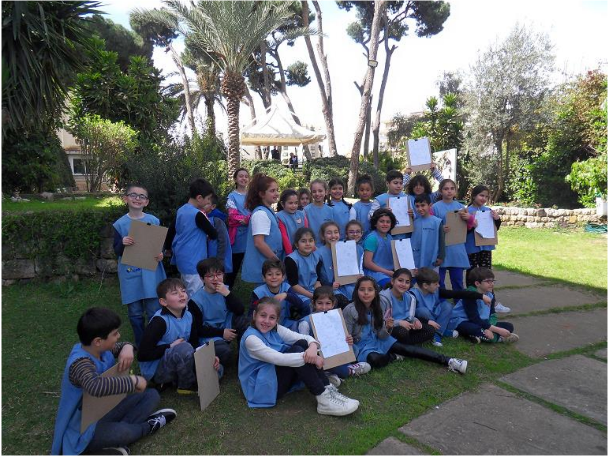
Le musée de la mer