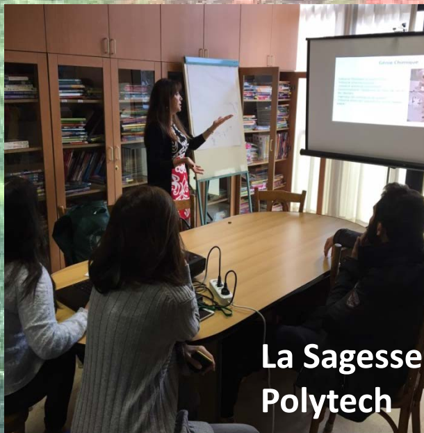
La Sagesse Polytech