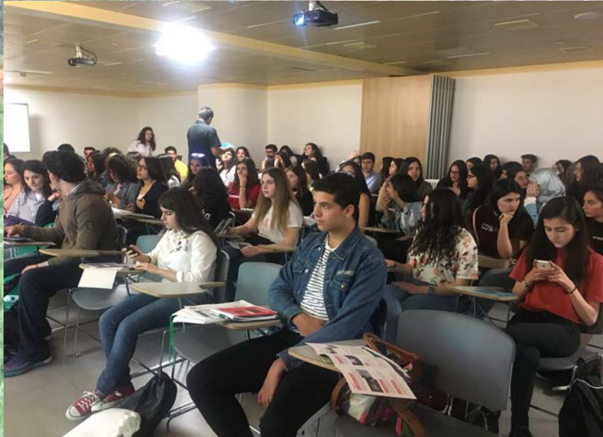
Classes ouvertes à l'USJ (shadowing)